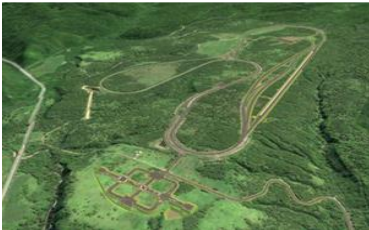
Il Bifuka Proving Ground visto dall'alto.